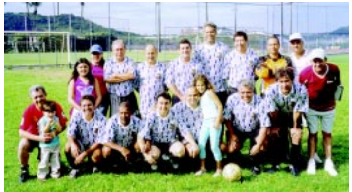
Time do Cruzeiro , campeão 28 a 42 anos. Time do Linhares , campeão acima de 43 anos