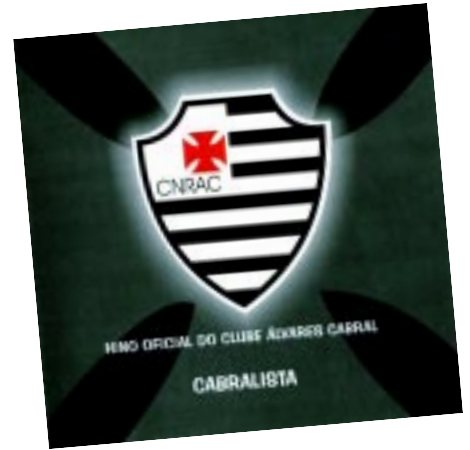
Capa do Cd

"O Cabralista" reflete o orgulho de cada associado, diretor e atleta pelo grandioso trabalho na área de esporte do Clube Álvares Cabral, no cenário estadual e nacional. Desta forma, não deixe de adquirir o CD, na secretaria do Clube, no valor de R$ 10,00 (preço subsidiado), e ter essa importante homenagem a um Clube centenário que já mostrou, por meio da diretoria e dos atletas, que está preparado para vencer todos os obstáculos.