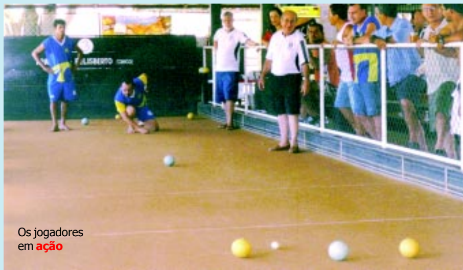
Os jogadores em ação

Além do Estadual, o Álvares Cabral ainda disputou o campeonato entre clubes e comunidades, promovido pela Prefeitura Municipal de Vitória e com apoio da Federação. Foram cinco duplas cabralistas, num total de 168 participantes, que disputaram nas comunidades do muni-