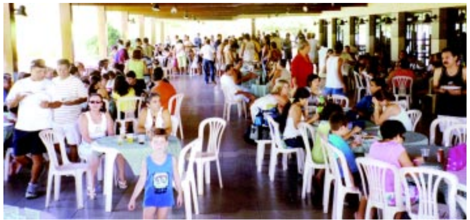
Festa de encerramento do campeonato

Os artilheiros do campeonato, na categoria de 28 a 42 anos, foram Iri-