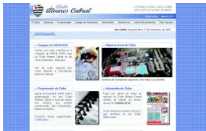
Veja o novo formato do site

No site o associado ficar  por dentro do dia-a-dia do Clube, al m de saber um pouco mais sobre a sua hist ria e, o que   melhor, ter  acesso as programa oes e ao informativo impresso o "O Cabralista".