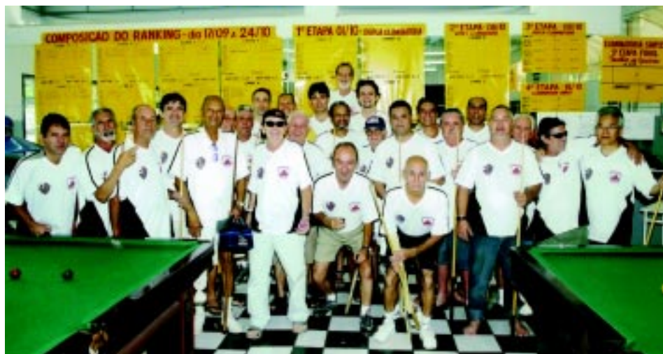
Grupo dos sinuqueiros que participaram do campeonato

Ao todo foram 64 participantes, mas destes, somente 30 estão na relação dos rankiados que é dividido entre ouro, do primeiro ao décimo colocado; prata, do 11º ao 20º; e bronze, do 21º ao 30º. A premiação aconteceu em ritmo de confraternização durante um churrasco, na própria sede Clube no dia 16 de outubro,