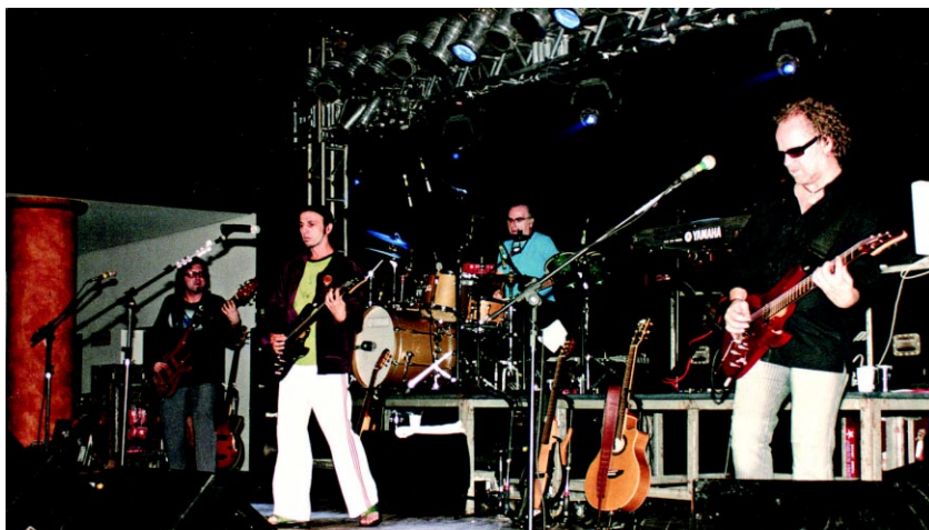
Show do Zeca Baleiro , no último dia 17 de março, teve lotação máxima