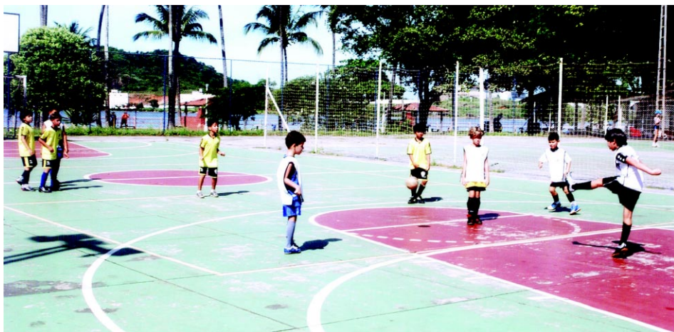
As crianças se divertiram com o retorno das escolinhas

Desta forma, no dia 25 muitos pais e familiares fizeram questão de prestigiar o evento. As escolinhas são gratuitas, para os filhos dos associados, e vão funcionar todos os sábados. Tragam seus filhos