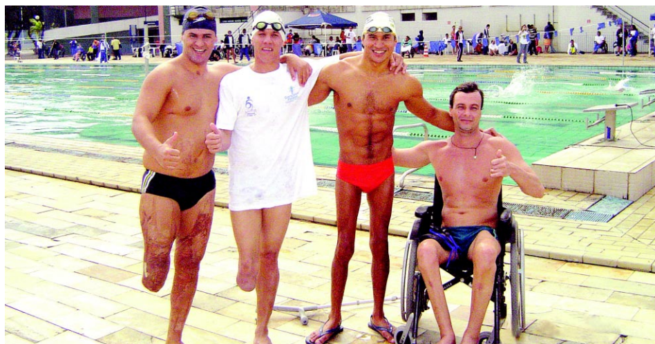
Atletas do Álvares/ACPD, que fazem parte do projeto social, com o campeão paraolímpico Clodoaldo Silva

rio no projeto, Leonardo Miglinas, informou que as aulas para as crianças carentes são oferecidas as terças e quintas. Já as voltadas para deficientes são realizadas todas as segundas, quartas e sextas.