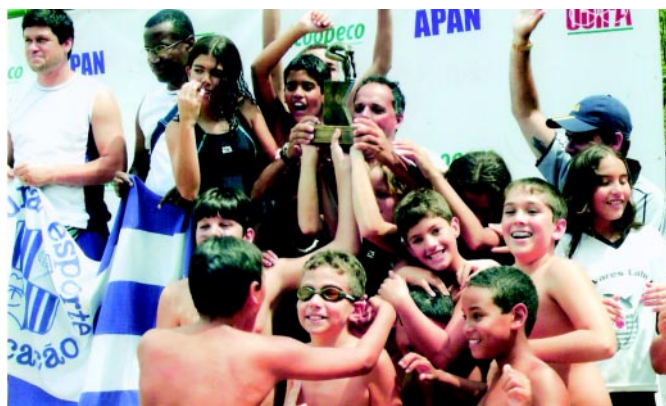
Equipes Petiz e Mirim comemoram durante a Premiação