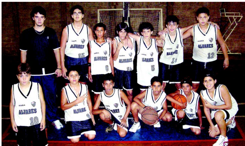
Atletas da equipe Mini posam para foto antes do jogo contra o CETAF